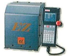
EZコントローラ(1.0KW用) 入力電源:単相AC200/230V 寸法:225×275×260