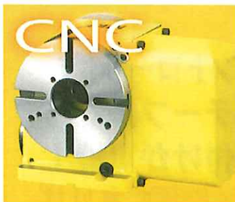
CNC円テーブルシリーズ