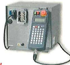
New AR21コントローラ(400W,750W用) 入力電源:単相AC200/220V 寸法:300×280×285, 10kg