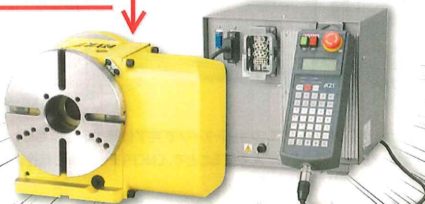
コントローラ付き CNC 円テーブル