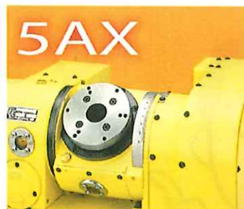
傾斜CNC円テーブルシリーズ